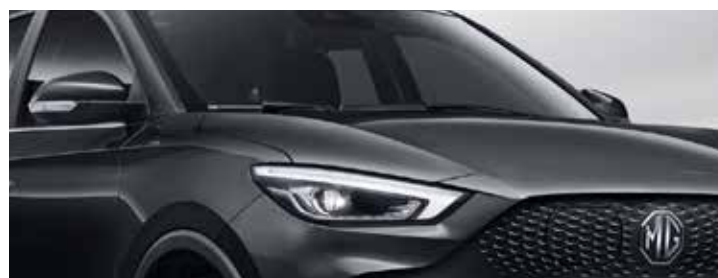
שחור מטאלי ●