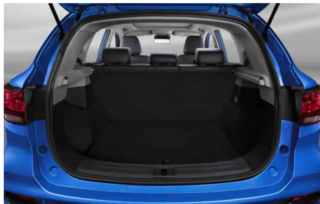
תא מטען מרווח