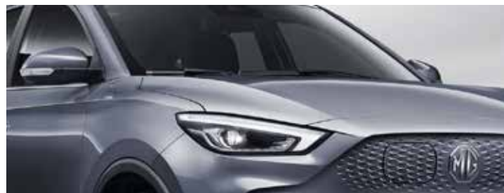
כסוף מטאלי ●