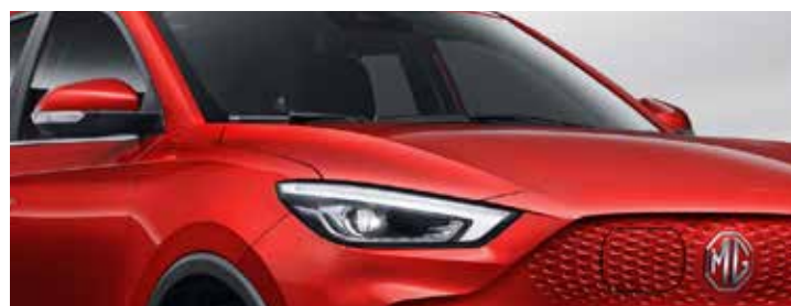
אדום מטאלי ●