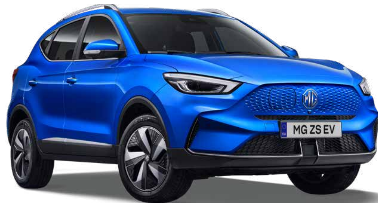
כחול מטאלי ●