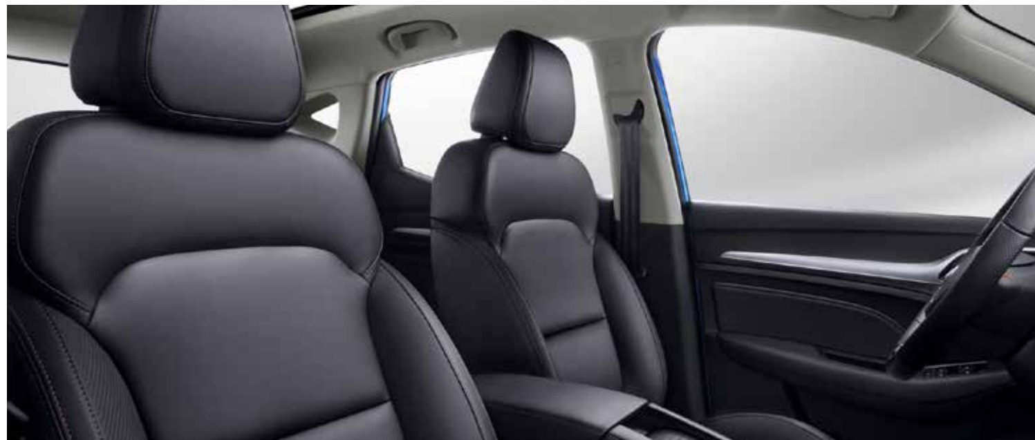
ריפוד דמוי עור בצבע שחור עם תפרים אדומים