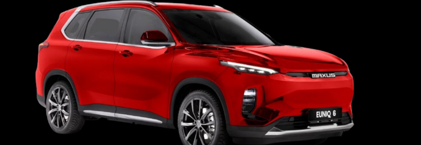
* תמונות להמחשה לבר, יתכנו הבדלים קלים בין תמונת הרכב לבין הרכב עצמו