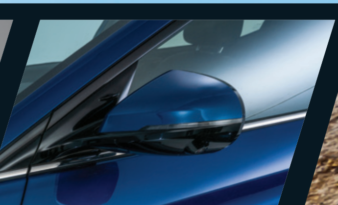
מראות צד מתקפלות חשמלית