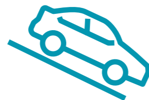
HDC - מערכת בקרת ירידה במדרון