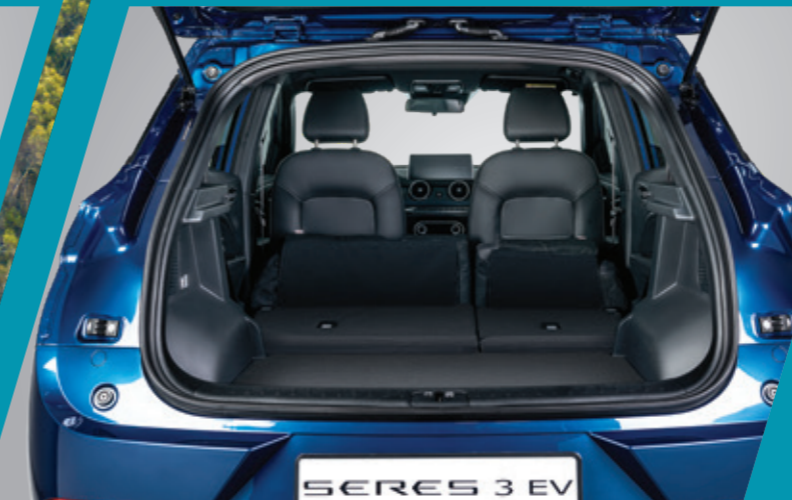
מושב אחורי מתקפל גב המושב האחורי מתקפל למצב שטוח לקבלת נפח מטען וגמישות מרביים.

הודות למידות הפנים הנדיבות, גם לך וגם לנוסעים מובטחת נסיעה נינוחה, שפע של מקום ודרכים חכמות לנצל אותו. המושב האחורי רב-תכליתי מתקפל ביחס של 60:40 וגם למצב שטוח, ומאפשר להגדיל את מרחב האחסון העומד לרשותך.