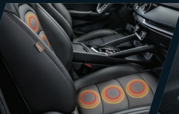
מושבים קידמיים עם כוונן חשמלי וחימום

הודות למידות הפנים הנדיבות, גם לך וגם לנוסעים מובטחת נסיעה נינוחה, שפע של מקום ודרכים חכמות לנצל אותו. המושב האחורי רב-תכליתי מתקפל ביחס של 60:40 וגם למצב שטוח, ומאפשר להגדיל את מרחב האחסון העומד לרשותך.