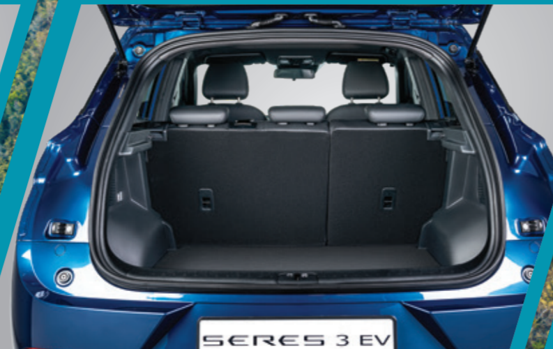
גמישות פנימית החלל הפנימי של Seres 3 גמיש מספיק כדי לתמוך בסגנון חיים פעיל ודינאמי. מושב אחורי מפוצל ומתקפל ביחס 60:40