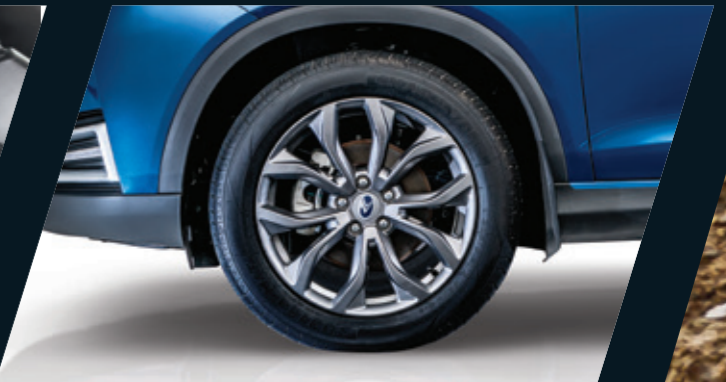
חישוקי אלומיניום בגודל 18"