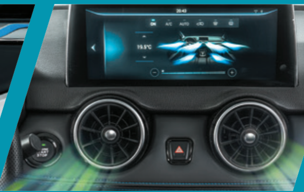
מערכת בקרת אקלים ופתחי מיזוג למושבים אחוריים