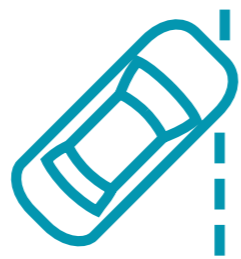
LDWS - מערכת התראה סטייה מנתיב