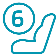
6 כריות אוויר - ההגנה כוללת כריות אוויר קדמיות לנהג ולנוסע הקדמי, שתי כריות אוויר צדיות ושתי כריות וילון הנפרשות לכל אורך תא הנוסעים