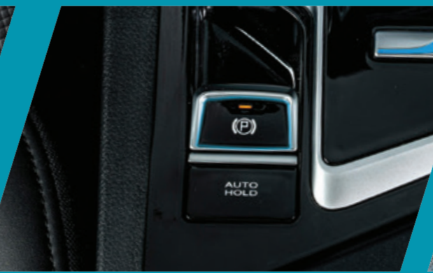
בלם חניה חשמלי