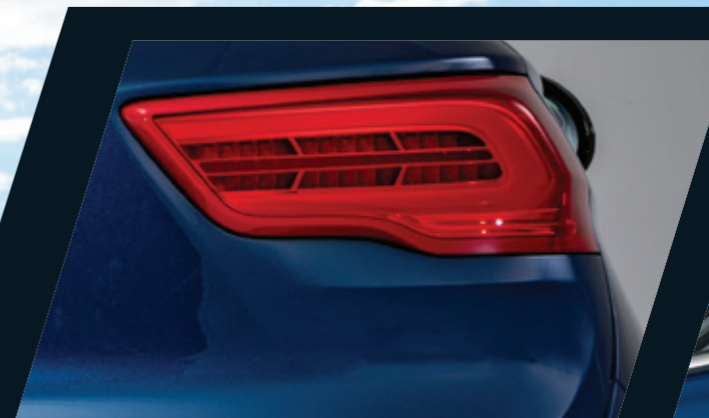
יחידת תאורה אחורית LED