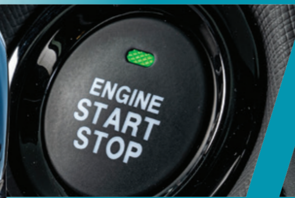
"מפתח חכם" לכניסה והנעה ללא מפתח