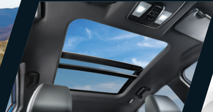
חלון גג פנורמי נפתח עם וילון חשמלי