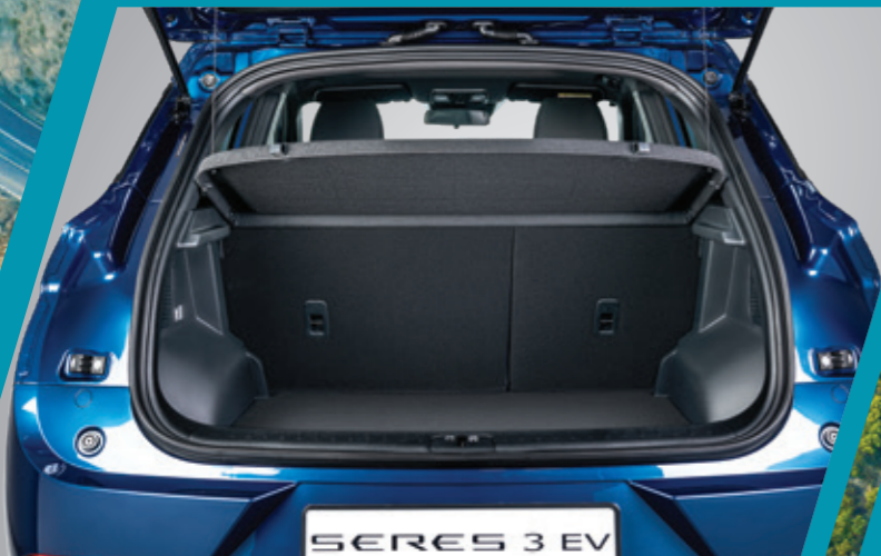
כיסוי לאזור המטען