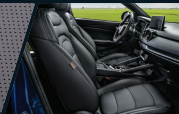
ריפוד דמוי עור

נפח תא מטען - כאשר המושב האחורי במצב סטנדרטי - 318 ל' נפח תא מטען - כאשר המושב האחורי מקופל למצב שטוח - 1,500 ל'