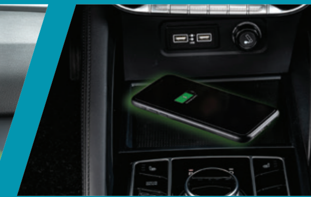
משטח טעינה אלחוטי לטלפון