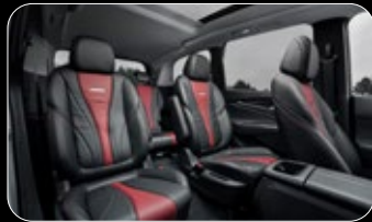
שורת כסאות שניה מושבי "קפטן" נפרדים ומרווחים