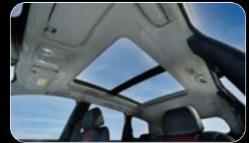
גג פנורמי נפתח