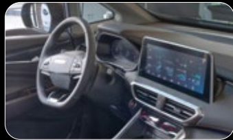
ידיד הילוכים צמודה להגה