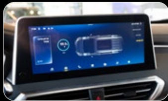
תצוגת אחוז סוללה