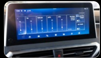
תצוגה מערכת מולטי מדיה בעברית