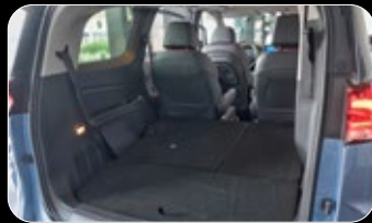
נפח תא מטען מקסימלי (שורה 3 מקופלות)