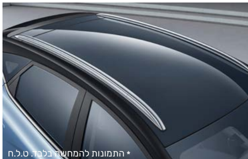
* התמונות להמחשה בלבד. ט.ל.ח.