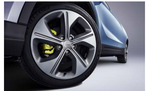
* בדגמי PRO בלבד.